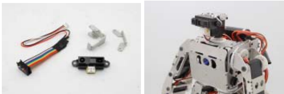
左:ロボビー・ナノ用 PSD センサセット「VS-PSD3N」

ロボビー・ナノ用 PSD センサセットはロボビー・ナノの頭部に PSD センサを取り付け可能なブラケットパーツが付属した PSD センサユニットです。8chアナログ入力拡張ボードと合わせてお使いいただくことで、センサ情報を取得し、ターゲット探査などロボットの自律化が可能になります。